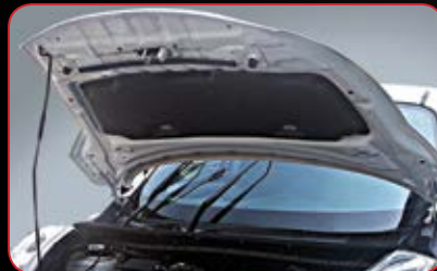
Engine Hood Insulator