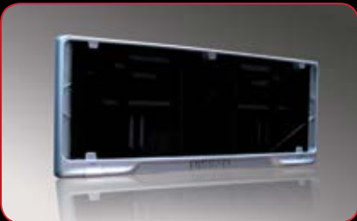
License Plate Frame