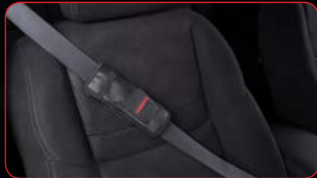
Seat Belt Pad