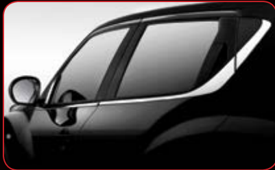
Chrome Window Molding