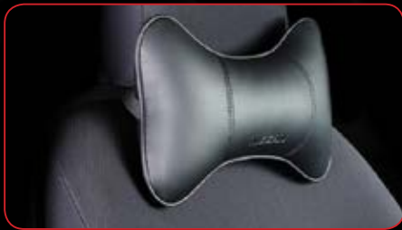
Curve Pillow (Black)