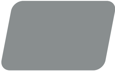
Smoke Grey Metallic