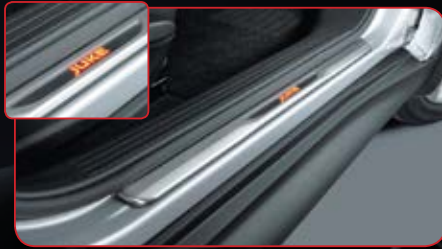
Kicking Plate with LED