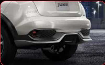
Rear Lower Bumper Panel