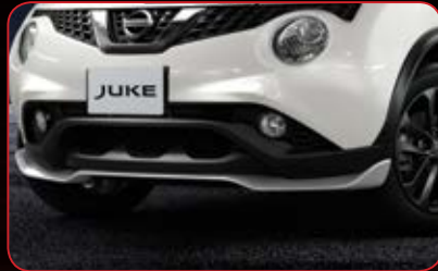
Front Lower Bumper Panel