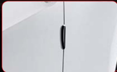
Door Edge Molding