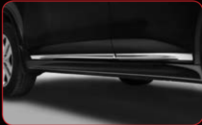
Chrome Door Sill Molding