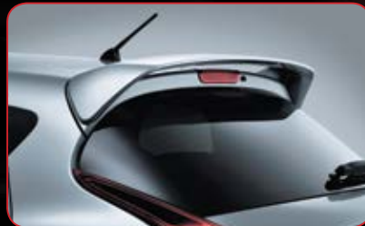
Rear Roof Spoiler