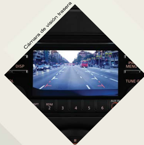
Cámara de visión trasera