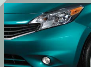
Luces de halógeno y de niebla