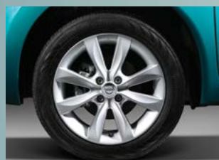
Aros de aluminio 16"