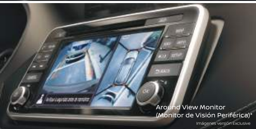
Around View Monitor (Monitor de Visión Periférica)*