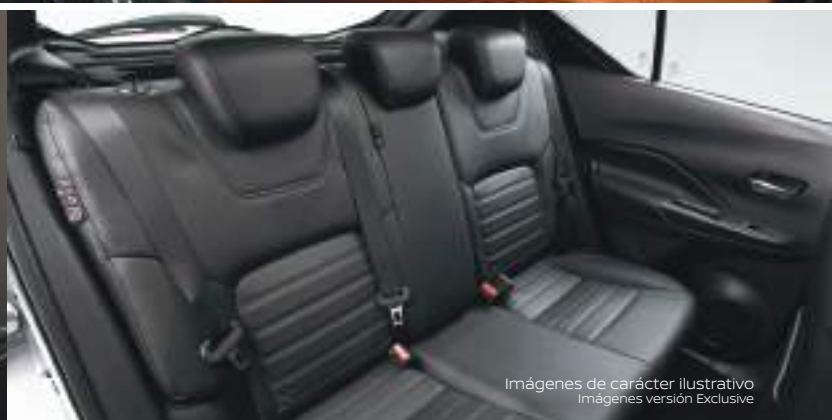
Imágenes de carácter ilustrativo Imágenes versión Exclusive