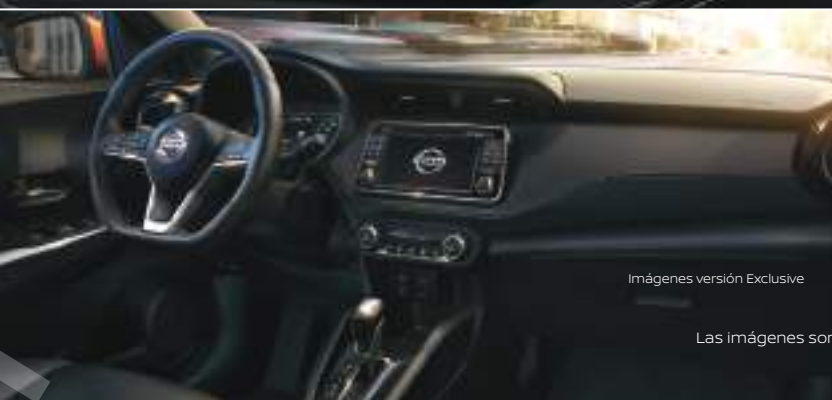
Imágenes versión Exclusive