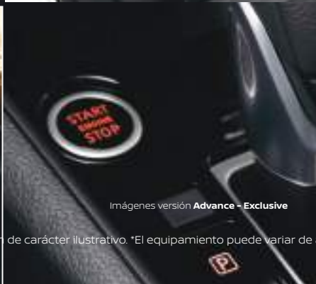
Imágenes versión Advance - Exclusive