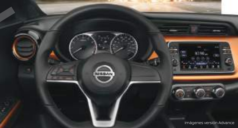
Imágenes versión Advance