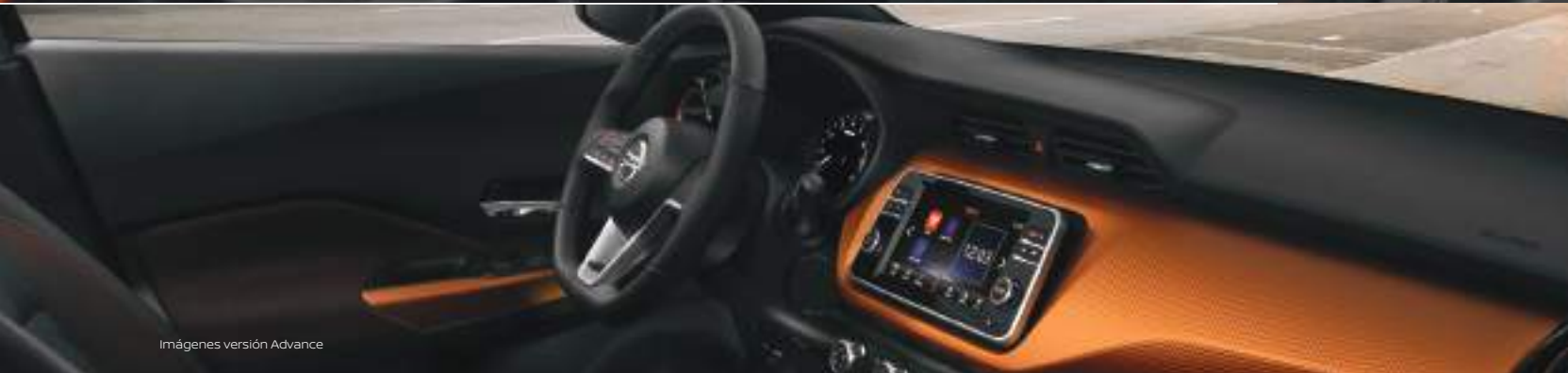
Imágenes versión Advance