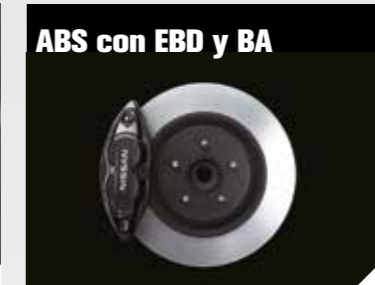
ABS con EBD y BA