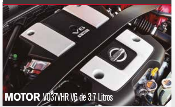
MOTOR VQ37VHR V6 de 3.7 Litros