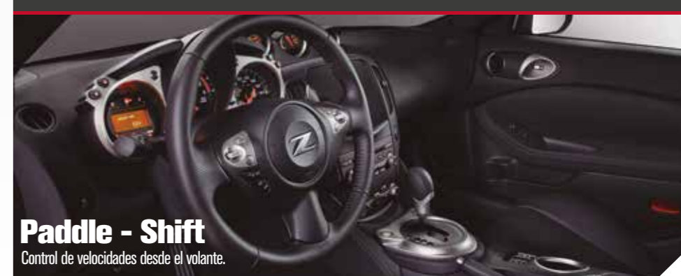
Paddle - Shift Control de velocidades desde el volante.

Con la conveniencia de la caja automática, siempre mantendrás el control del 370 Z. Siente la emoción de los cambios perfectamente sincronizados y la satisfacción de obtener cambios suaves y precisos en cualquier momento.