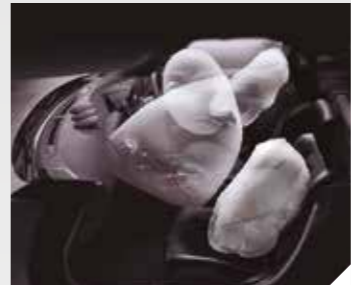
Airbags delanteros, laterales y tipo cortina. Ayudan a reducir el riesgo de lesiones como resultado de un impacto.