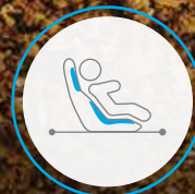
SISTEMA DE SUJECIÓN INFANTIL (ISOFIX)*