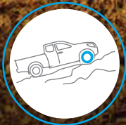
ASISTENTE DE ASCENSO EN PENDIENTE (HSA)