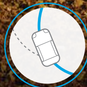
CONTROL DINÁMICO VEHICULAR (VDC)