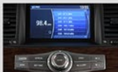
Sistema de Audio Bose® con 9 parlantes + 2 woofers + 2 tweeters.