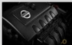
Motor 5.6L, V8, 32 válvulas y 318 HP.