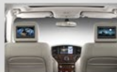
Monitores traseros LCD de 8" a color.