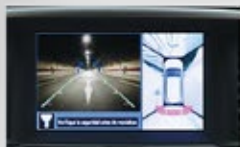
Pantalla de 8" con monitor de visión periférica (AVM).