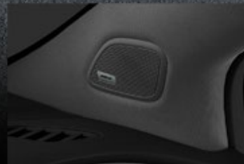
Sistema de audio premium Bose®.