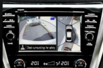
Around View Monitor.