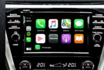
Carplay / Android Auto.