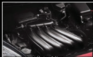
Motor 1.6L Con 106 Caballos de fuerza.