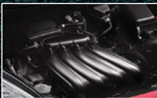
Motor 1.6L Con 106 Caballos de fuerza.