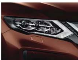
Imperial Amber - P - CAS

S = standard; M = métallisée; P = peinture nacrée