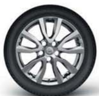
Jante alliage 17" (argent)