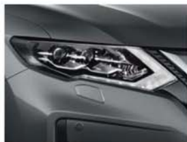
Dark Grey - M - KAD