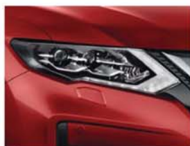
Solid Red - S - AX6