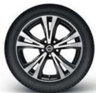
Jante alliage 18"