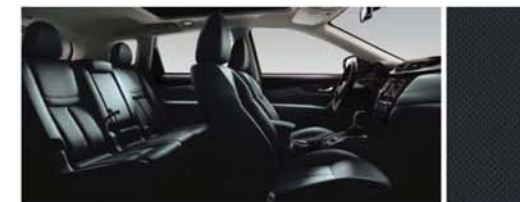
CUIR PERFORÉ - NOIR