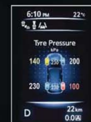
PRESSION DES PNEUS