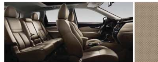
CUIR PERFORÉ - BEIGE