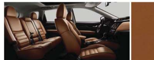
CUIR TAN À SURPIQÛRES ET INSERTS NOIRS