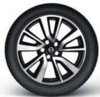
Jante alliage 19"