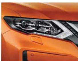
Monarch Orange - P - EBB