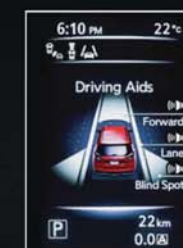
SYSTÈME D'INFORMATION DU CONDUCTEUR