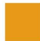
Naranja Imperial (EAU)