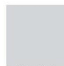
Gris Plata (K23)