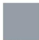
Gris Oscuro (KAD)