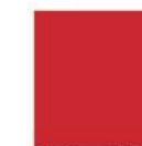
Rojo Sólido (A20)