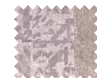
موكيت (رمادي زيتوني) Moquette (Olive Grey)

قد تختلف ألوان الهيكل وخامة تنجيد المقاعد بعض الشيء عن اللون الأصلي نظراً لإمكانات الطباعة. Paint and fabric representations may vary slightly from actual applications due to limitations of the print production process.