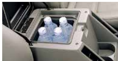
صندوق تبريد (اختياري) Cooler box (Optional)