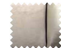
جلد بي في سي (رمادي زيتوني) PVC Leather (Olive Grey)