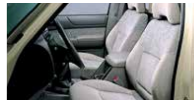
تلمس الفارق الذي تمنحك إياه المقصورة الرحبة، وخاصة في الرحلات الطويلة.

Take command with read-at-a-glance gauges and right-at-hand controls.