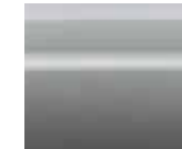
فضي (KY0) Silver (KY0)