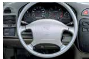
تحكم بقيادته بفضل العدادات الواضحة القراءة والفتايح الواقعة في متناول اليد.

Take command with read-at-a-glance gauges and right-at-hand controls.