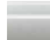
أبيض (QM1) White (QM1)