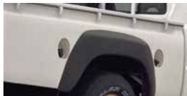
خزان وقود إضافي Sub-Fuel Tank

Top-of-the-class wheel stroke makes easy work of rough roads and unexpected obstacles.