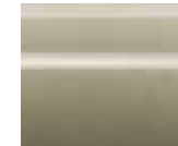
ذهبي فاتح (EY0) Light Gold (EY0)