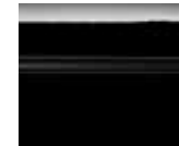
أسود (KH3) Black (KH3)