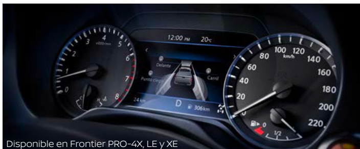
Disponible en Frontier PRO-4X, LE y XE

Mantén el control con Nissan Display de 7" de Frontier. Ya sea en tu próxima aventura Off Road o en tus paseos por la ciudad, el monitor de 7" te mostrará información precisa del vehículo. Con sólo un vistazo podrás saber detalles de la música que escuchas o ver el navegador, así como estar al tanto de las alertas de asistencia para el conductor.