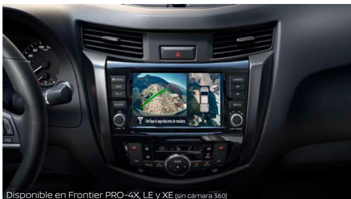
Disponible en Frontier PRO-4X, LE y XE (sin cámara 360)

Mantén tus contactos a la mano con Apple CarPlay™ . Escucha tu playlist desde iTunes®, realiza llamadas y revisa tus mensajes de voz. Localiza tu destino con los mapas de Apple® y encuentra la mejor ruta. Accede a Spotify™ activando el comando de voz desde el volante o dicta y escucha mensajes a través de Siri®.