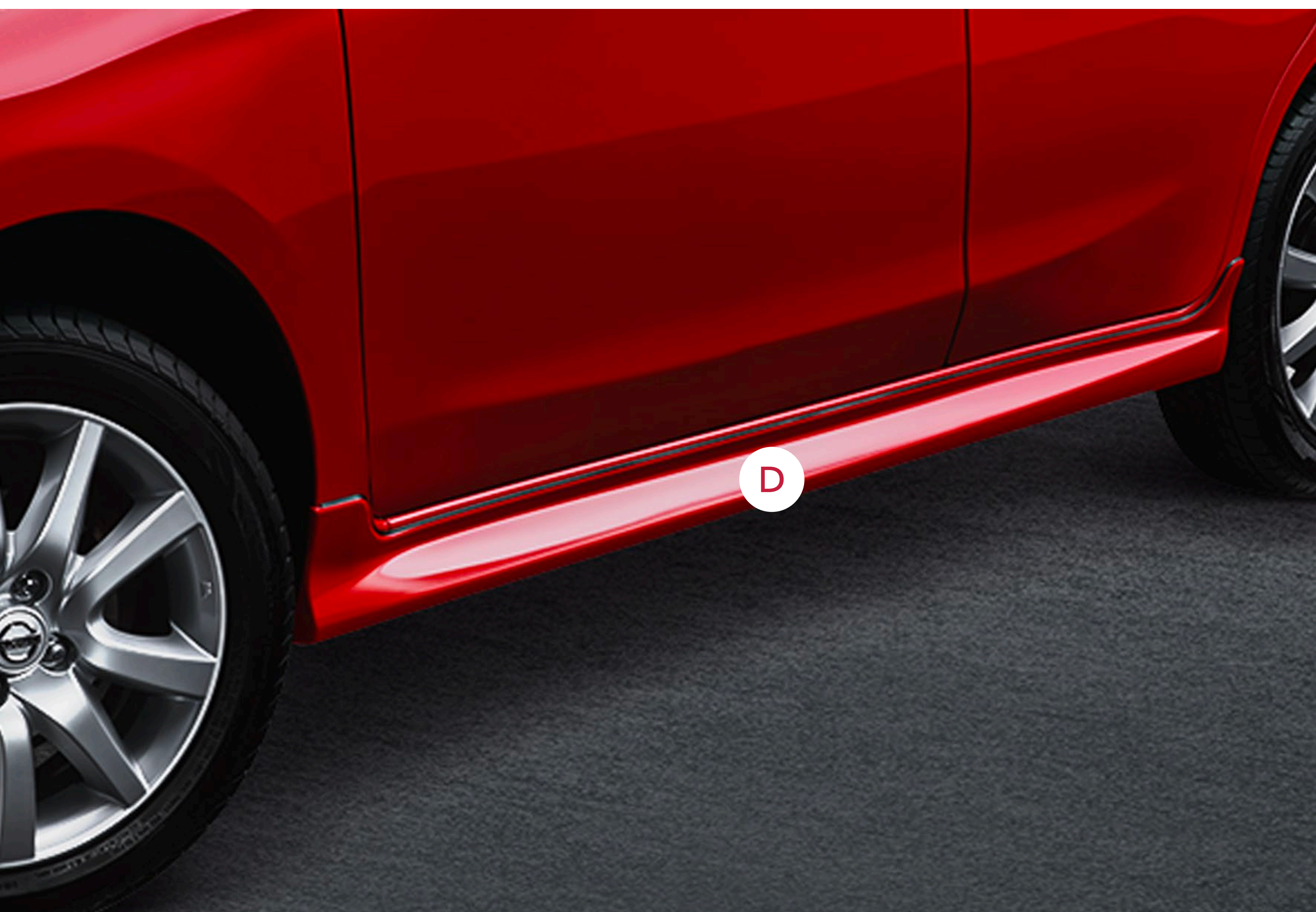
D JUEGO DE FALDONES LATERALES PRIMER G68E01HA0H Bs. 3.450