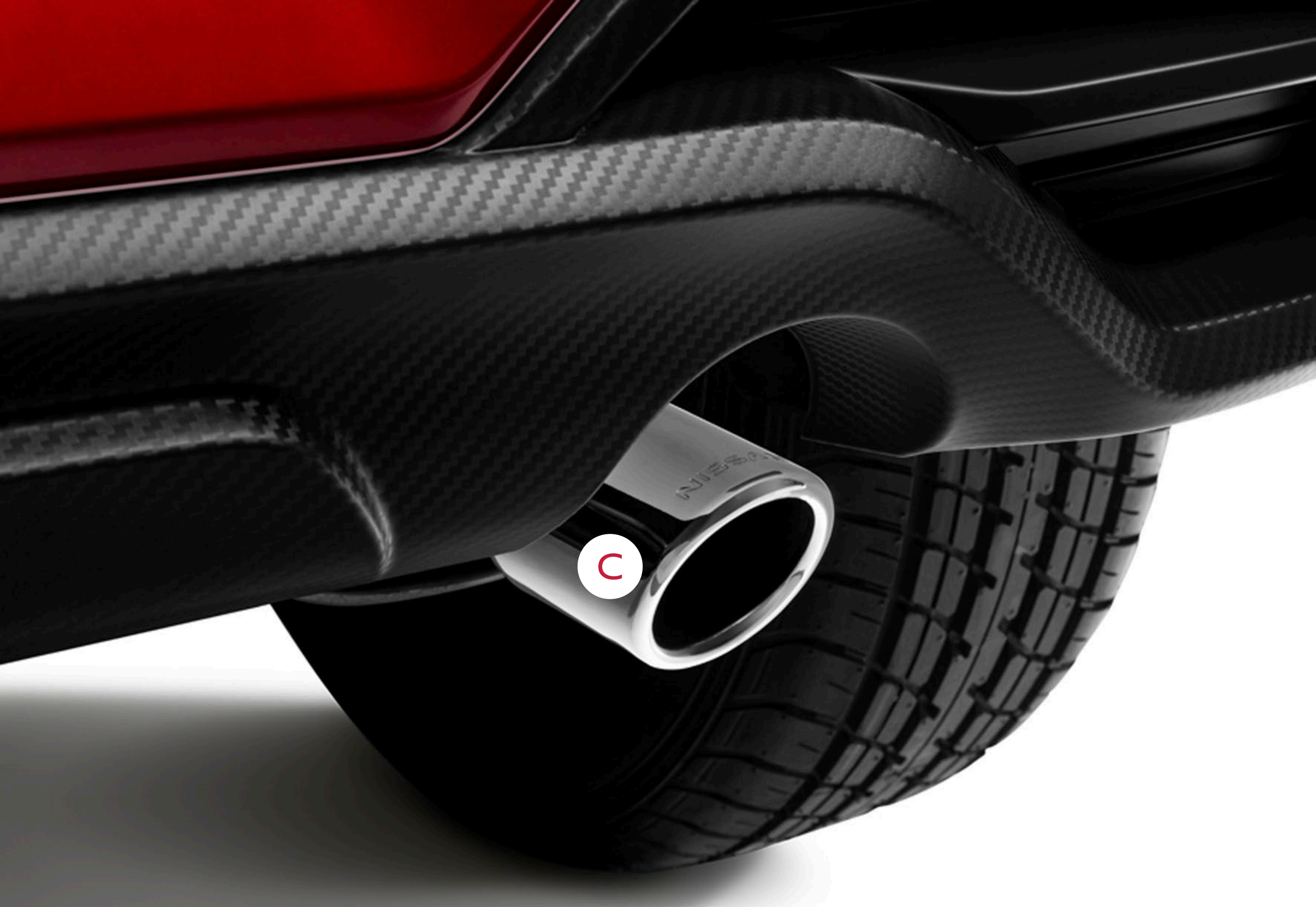
C COLILLA DE ESCAPE CROMADA NIMEX2A1X2 Bs. 398