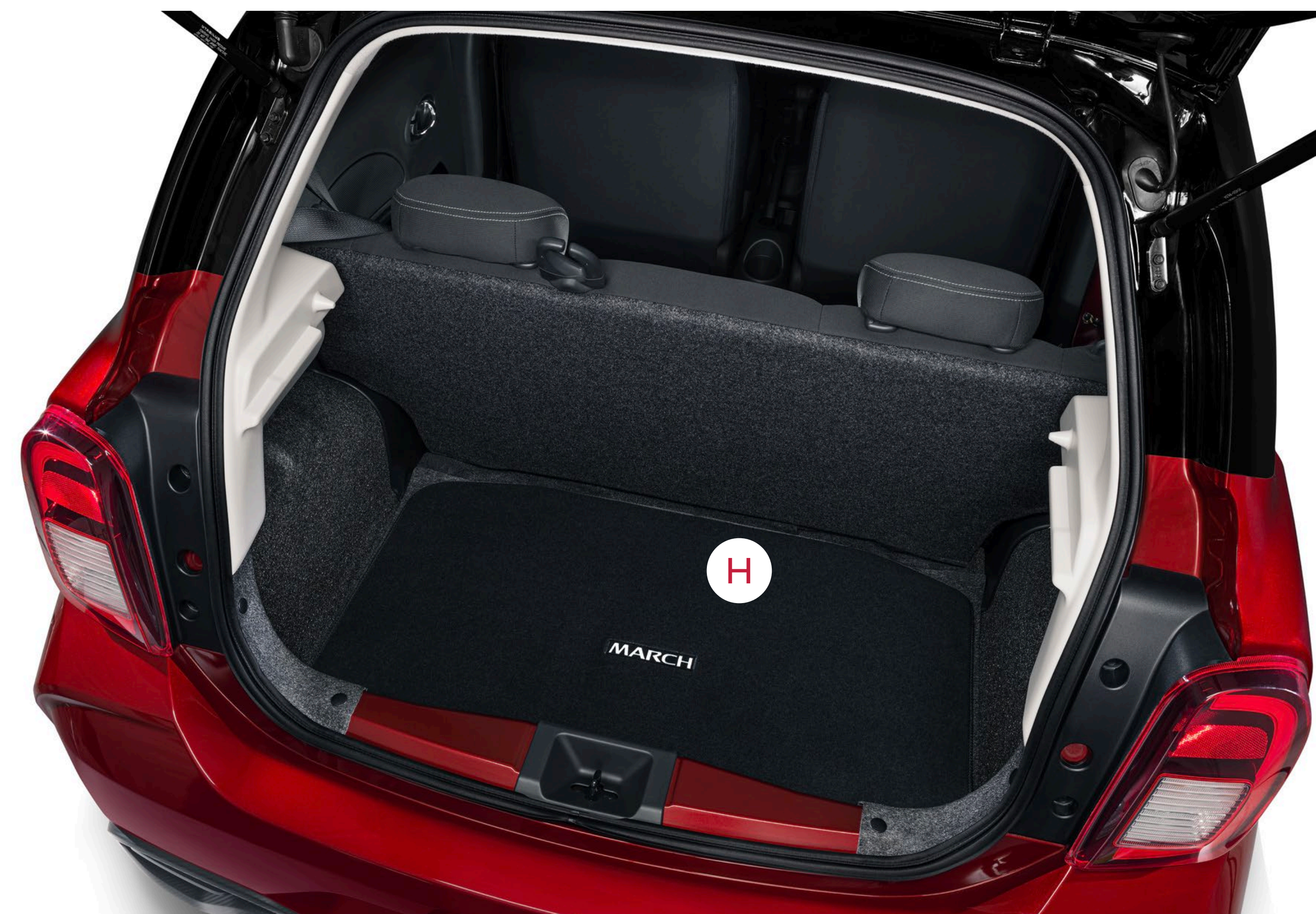
H TAPETE DE ALFOMBRA PARA CAJUELA NIMEX2A1N4 Bs. 790