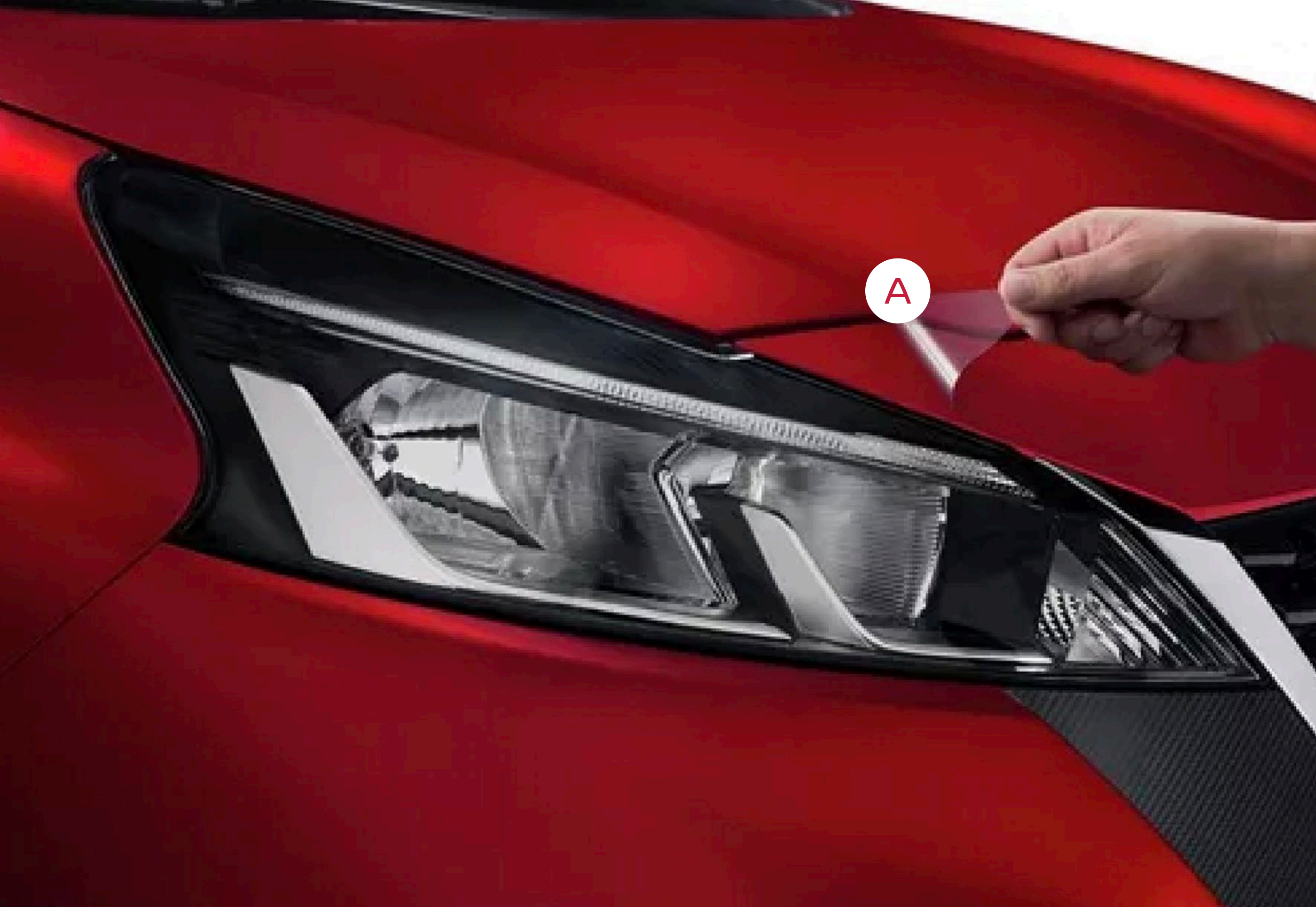
A ANTIFAZ TRANSPARENTE 3N3N19LTOA Bs. 1.350