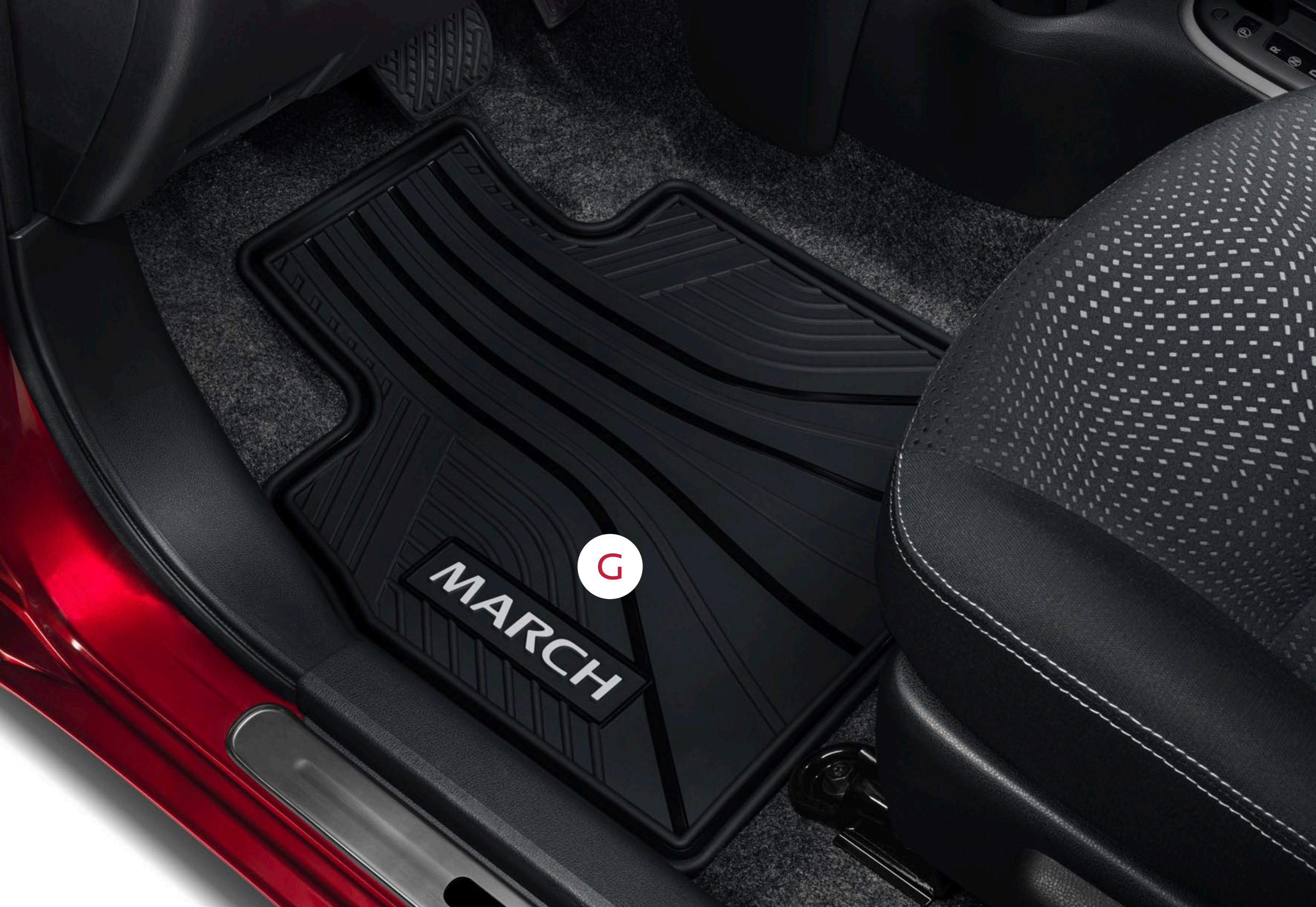
G JUEGO DE TAPETES DE HULE 3N3E19LTOA Bs. 540