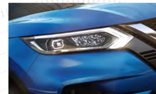
Faros LED con encendido automático y sistema de iluminación adaptativa*