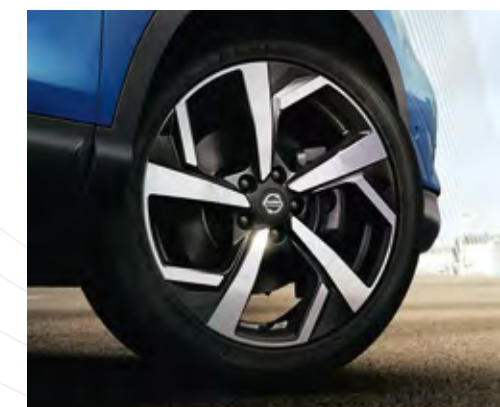
Aros de aleación de 19 pulgadas con diseño innovador*