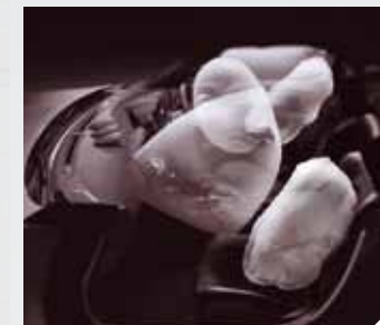
Airbags delanteros, laterales y tipo cortina. Ayudan a reducir el riesgo de lesiones como resultado de un impacto.