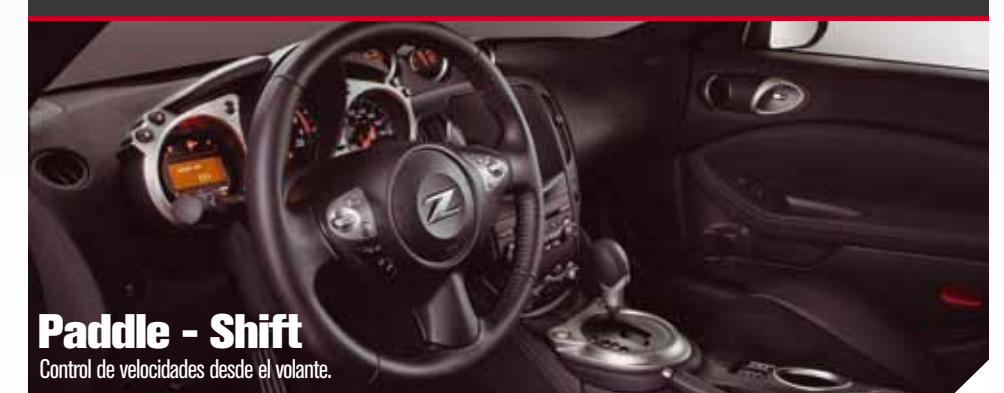
Paddle - Shift Control de velocidades desde el volante.

Con la conveniencia de la caja automática, siempre mantendrás el control del 370 Z. Siente la emoción de los cambios perfectamente sincronizados y la satisfacción de obtener cambios suaves y precisos en cualquier momento.