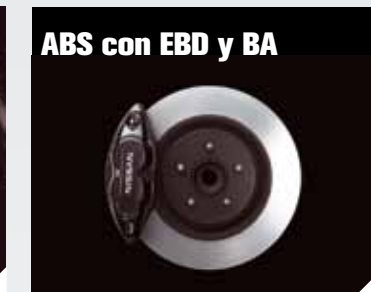
ABS con EBD y BA